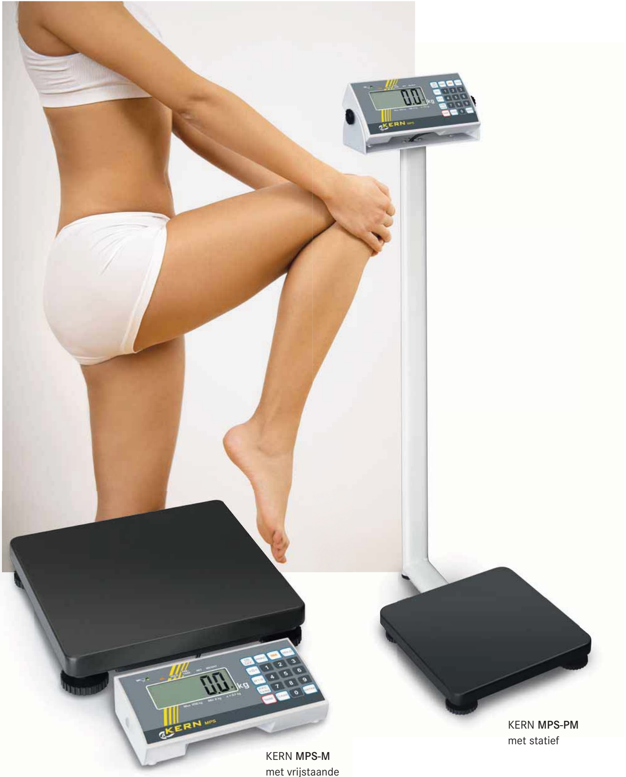
KERN MPS-M met vrijstaande weergave

Geijkte personenweegschaal met BMI-functie