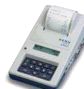
① Statistiekprinter, KERN YKT-01, € 650,-