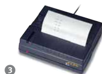
③ Standaardprinter, KERN YKB-01, € 270,- Voor alle printers zie pag. 85.

Met de receptuurfunctie kunnen verschillende bestanddelen van een mengsel worden bijgewogen. Ter controle kan het totaalgewicht van alle bestanddelen worden opgeroepen. Documenteren van het mengsel met standaardprinter KERN YKB-01 ③ mogelijk.