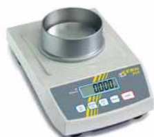
Weegplateau A standaard rondlopende windbescherming, Ø 90 mm, hoogte 53 mm