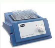
SBH130 - Analooq