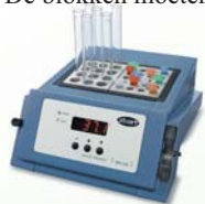
SBH130D - Digitaal