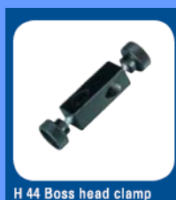
H 44 Boss head clamp