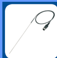
PT 1000.60 Temperature sensor