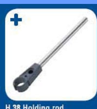
H 38 Holding rod