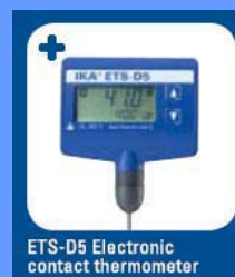
ETS-D5 Electronic contact thermometer