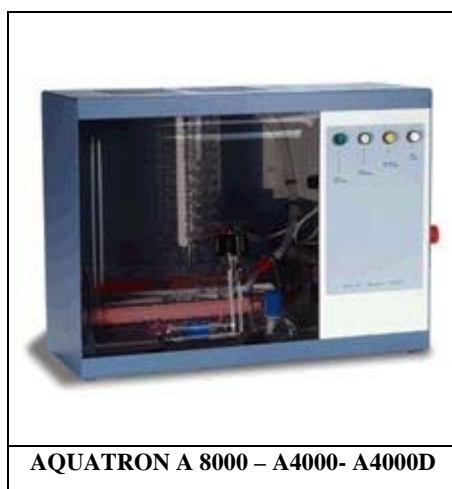
AQUATRON A 8000 – A4000- A4000D